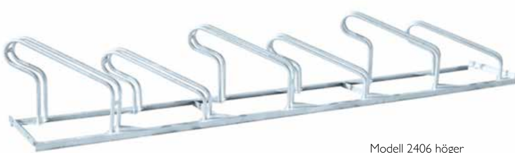
Modell 2406 höger